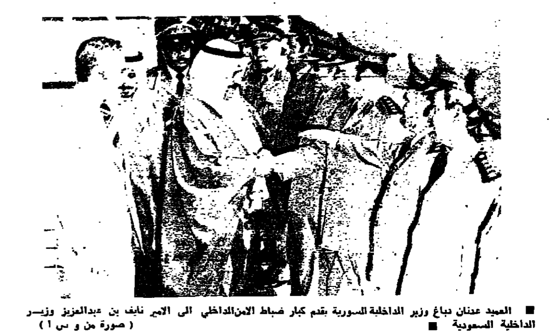
المعيد عدنان دباغ وزير الداخلية السورية يقدم كبار ضباط الامن الداخلي الى الأمير نايف بن عبدالعزيز وزير الداخلية السعودي